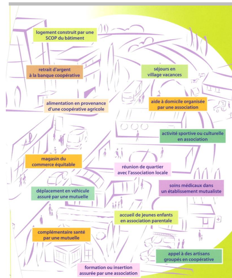
L'ESS présente au quotidien – Plaquette d'information de la CRES – Chambre Régionale de l'Économie Sociale de Bretagne

Animation / Gestion / Aide à Domicile / Médiation / Accompagnement / Suivi et Conseil social